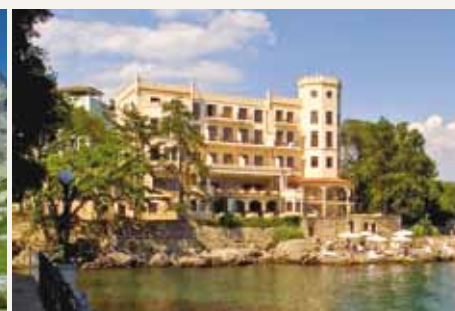
HOTEL MIRAMAR*****L ADRIA-RELAX-RESORT in Opatija

HOLLEIS HOTELS • ÖSTERREICH • KROATIEN www.holleis-hotels.com