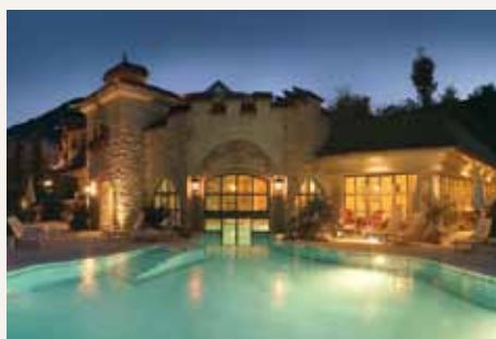
HOTEL SALZBURGERHOF***** in Zell am See

Esplanade 4-6, A-5700 Zell am See, Salzburger Land Tel. +43/(0)6542/788-0, Fax DW 305, info@grandhotel-zellamsee.at www.grandhotel-zellamsee.at