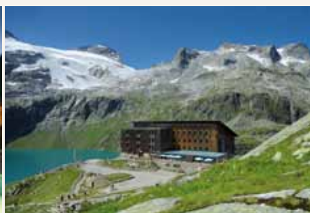
BERGHOTEL RUDOLFSHÜTTE*** in Uttendorf